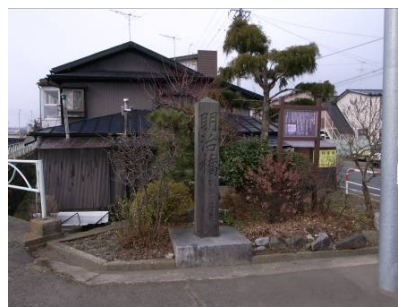
歴史的地物・街並みを活かした川づくりのあり方