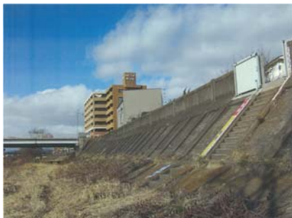
護岸の改修に合わせた景観づくりのあり方