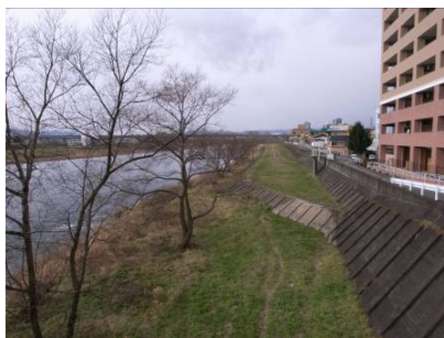
三川合流部～明治橋下流までつながる遊歩道整備のあり方